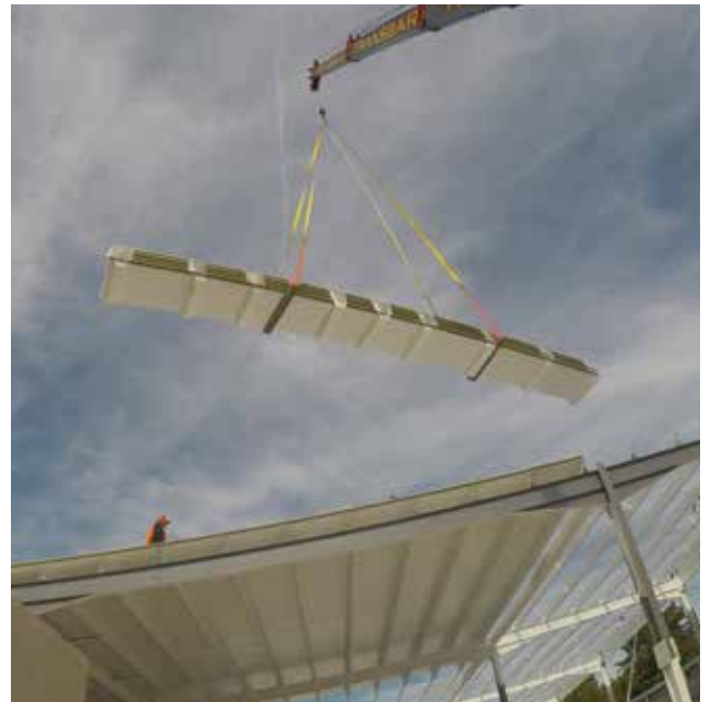
Producto aplicado: Panel BARILINE 2" Obra: Bodegas vidrios Millet Mérida, Yucatán.